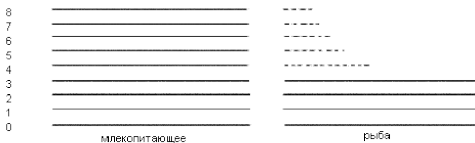
Рис. 3. «Матрицы» млекопитающих и рыб, скорректированные за счет гистологических данных.

Очевидно, что нижние четыре уровня «матриц» (от общебиологического уровня до уровня подтипа – Vertebrata ) как рыб, так и млекопитающих, должны быть идентичными. Разница, существующая в гистологической структуре этих двух таксономических групп, должна формироваться за счет пяти верхних уровней «матриц». «Как эмбрионы переходят от общих признаков к более частным, так и в процессе тканевой дифференцировки сначала появляются признаки общих тканевых типов, затем – признаки специализированных групп тканей и, наконец, признаки отдельных гистологических структур» (Мирзоян, 1980, с. 220–221). И, при этом, «разнообразие и специфичность тканевых производных каждого зародышевого листка возрастает по мере повышения организации животных» (Мирзоян, 1980, с. 226). На схеме это явление будет запечатлеться следующим образом (рис. 3). У «матрицы» рыб верхние пять ступеней, должны быть гораздо уже аналогичных ступеней млекопитающих, что должно уменьшить общую длину всех ступеней представителей класса рыб 6 .